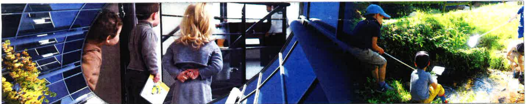
Quatre millions d'euros sont nécessaires pour construire cette nouvelle Calypso de 1.600 mètres carrés dans la zone d'activités de Valmy. Au 1er septembre, l'espace accueillera un jardin d'enfants, un centre de loisirs et proposera de nombreuses animations pour sensibiliser les classes de la maternelle au collège à l'environnement. Connecter l'enfant à la biodiversité pour l'aider à se construire, c'est l'un des enjeux du troisième établissement de la Calypso.